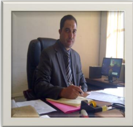
رئيسي التحرير: أ.د بوكهامش محمد

بسم الله الرحمن الرحيم والصلاة والسلام على أشرف المرسلين وبعد: تواصل مجلة الحقوق والعلوم السياسية مسيرتها العلمية والبحثية بإصدارها العدد 13 في موعده متضمنا باقة من المقالات العلمية المتخصصة في حقل الحقوق والعلوم السياسية، والتخصصات ذات الصلة؛ حيث احتوى العدد على 20 مقالا تم التركيز فيها من قبل الباحثين على مجالات الحوكمة، الحكم الراشد وأهم المظاهر المجسدة لهما، كما نال مجال الدراسات الأمنية حيزا ضمن العدد، إلى جانب التنمية الاقتصادية والاجتماعية، إضافة إلى مواضيع متعلقة بالعلوم الجنائية والسياسة الجنائية الحديثة سيما ما تعلق بالجريمة الإلكترونية.