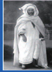
الشيخ أحمد مرزوق الحبيباتي عام 1939م

مجلة محكمة نصف سنوية تعنى بقضايا الفكر والتراث الإسلامي