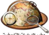
مخبر الدراسات التاريخية المتوسطة عبر العصور