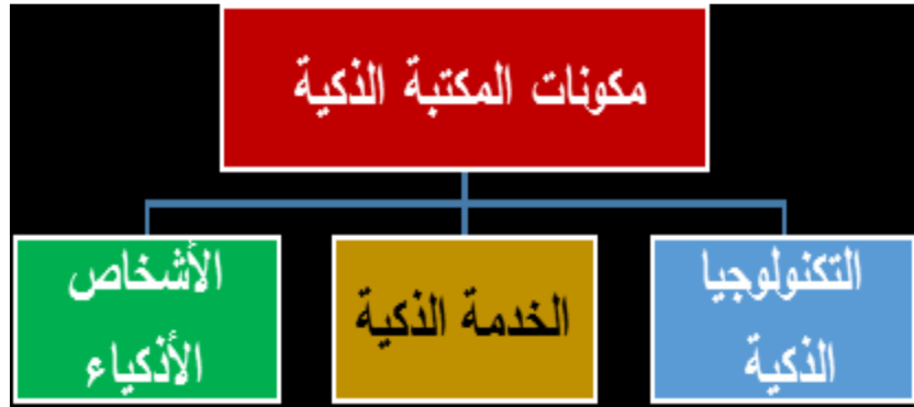
الشكل رقم 01: تمثيل لمكونات المكتبة الذكية

المستفيدين المحتملين وذلك من خلال التنسيق مع متعاملي شبكات الهاتف النقال ببث رسائل عامة للمجتمع الذي تخدمه ضمن نطاقها الجغرافي في إطار العلاقات العامة ومهمتها التسويقية 1 .