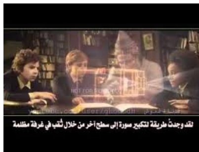
صورة رقم 01 : مأخوذة من فلم مكتبة الأسرار 13

وقد فاز هذا الفلم بأكثر من عشرين جائزة عالمية، بما في ذلك اعتباره "أفضل فلم" في كل من لندن ولوس أنجليس وكان ، وكذلك مهرجان نيويورك.