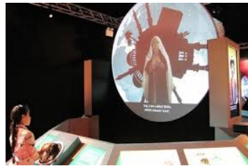
صورة لشاشة إلكترونية تعرض السيدة فاطمة الفهري - قدمت في المعرض - 24

وفي المعرض يتم اللقاء مع فاطمة الفهري ، المرأة الشابة التي بنت أول جامعة حديثة في العالم والتي كانت توفر التعليم المجاني للرجال والنساء من مختلف الأماكن والبيئات.