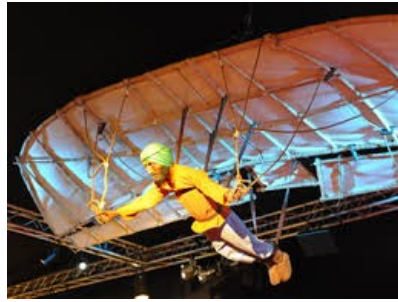
صورة رقم 04: تمثل مجسم لبداية التحليق عند المسلمين - قدم خلال المعرض - 22