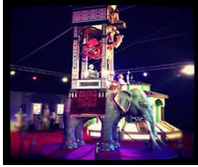
صورة رقم 02 : تمثل مجسما لساعة الفيل - مأخوذة عن موقع المعرض 14