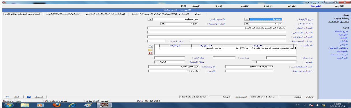
شكل 01: نافذة فهرسة كتاب بعنوان:بشائر أهل الإيمان بفتحات آل عثمان، في نظام سنجاب.