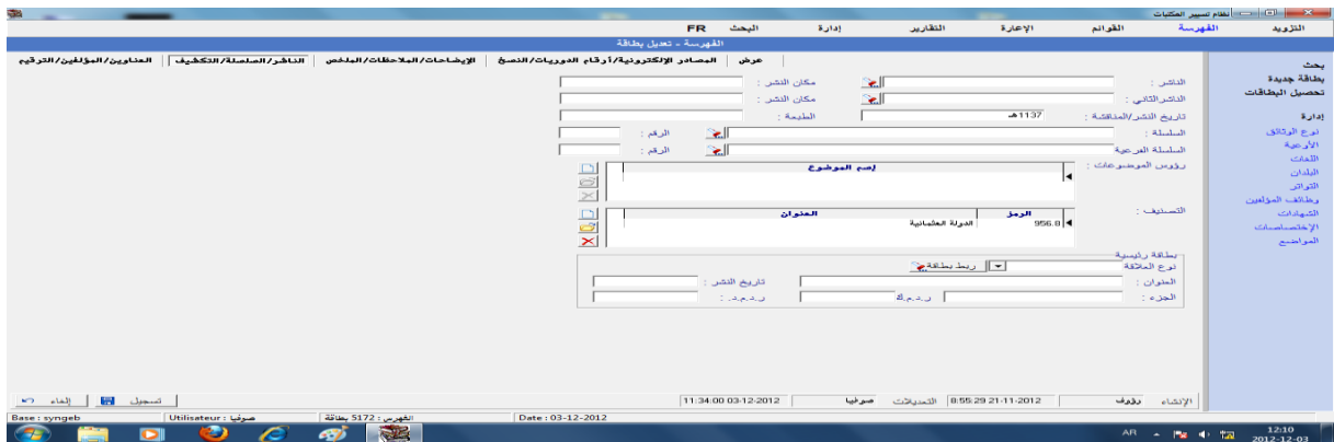
شكل 02: نافذة فهرسة كتاب بعنوان:بشائر أهل الإيمان بفتحات آل عثمان، في نظام سنجاب.

وهذه الحقول كلها مخزنة في الحاسوب وما على المفهرس فقط الدخول إلى البطاقة الفهرسية ثم إدخال المعلومات من الكتاب إلى الحاسوب وتخزينها ثم استرجاعها عند الحاجة إليه.