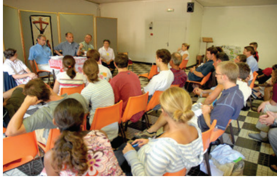
صورة رقم 1: جانب من يوم إعلامي لمسؤولي منظمة "فيدسكو" مع جمهور الزوار والفضوليين

ب-1- يخصص اليوم الأول للقاء والاكتشاف بين المتطوع ومسؤولي منظمة "فيدسكو": وتسميه "فيدسكو" بيوم الاكتشاف وتقوم بتنظيمه بصفة دورية مستمرة منذ بداياتها وهي مرة في كل شهر ويتم الإعلان عنه عبر موقعها الإلكتروني والمدونات التي ترتبط بها وكذلك عن طريق الدعاية والإشهار عبر نشراتها ومجالاتها وكذا عبر القناة - التنصيرية -، الكاثوليكية- « KTO tv » 1 - ويتم ذلك بالإعلان والدعوة لكل من يرغب في الاطلاع على ما تقوم به "فيدسكو".