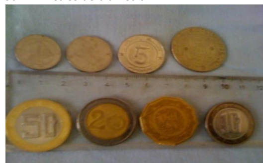
Figure 4 : différents types de pièce de monnaie.

200 lire ( Figure 5 ), elles sont de tailles variant entre 20 à 30 millimètres de diamètre.