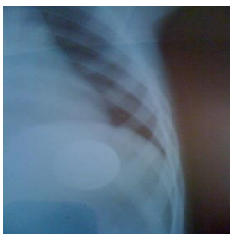
Figure 3 : localisation de la pièce dans l'estomac.

L'exploration a permis de confirmer la présence du corps étrangers (CE) dans 60 cas, un CE a été poussé accidentellement par l'opérateur dans l'estomac au moment de l'exploration et l'ASP a permis de le localiser ( Figure 3 ), 2 corps étrangers n'ont pas été visualisés.