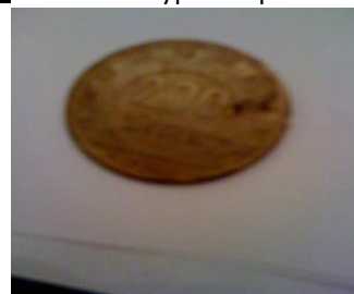
Figure 5 : une pièce de 200 liras