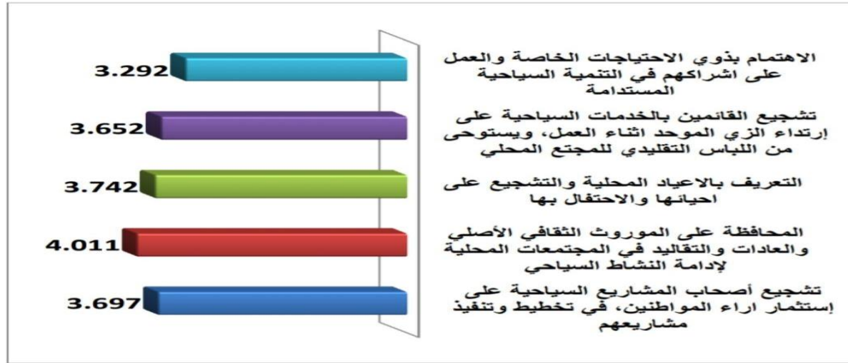
الشكل (3) الاوساط الحسابية للبعد الاجتماعي