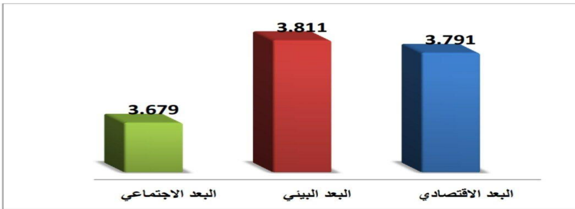
الشكل (4) الاوساط الحسابية لأبعاد متغير التنمية السياحية المستدامة