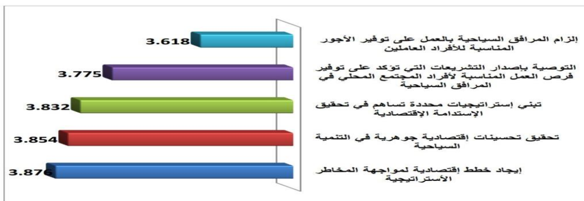
الشكل (1) الاوساط الحسابية للبعد الاقتصادي

المصدر: من إعداد الباحث بالإعتماد على مخرجات برنامج SPSS V.28