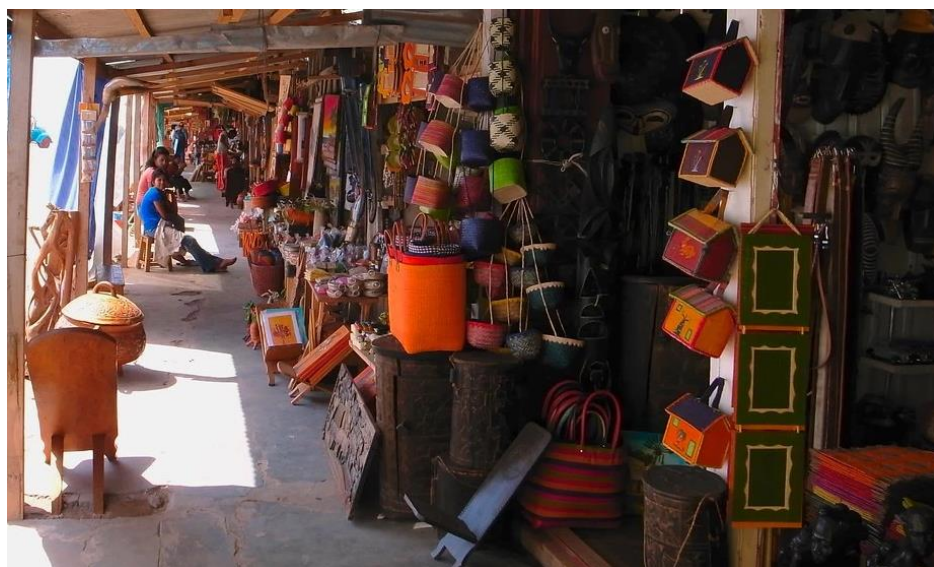
Figure 3 : Marché artisanale de la digue Ambohitrimanjaka

Nous observons également que 25,5 % des produits artisanaux sont vendus sur le marché régional. Il est donc évident que l'artisanat malgache occupe une position importante dans la région de l'océan Indien. Cela indique que ce secteur joue un rôle significatif dans les exportations nationales et contribue au développement de l'économie locale. Un exemple concret de cette dynamique est le marché du village des arts à Antananarivo, où les artisans vendent leurs produits et organisent des foires nationales et/ou régionales.