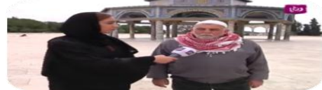
(البلدة القديمة-القدس: www.youtube.com/watch?v=TcWxp7gqpZc الدقيقة: 4.00-7.30)

وفي أحد الحوارات لم تتمكن الإعلامية من الحديث بحدّة مع أحد المستوطنين، والشكل الآتي يُبين ذلك: