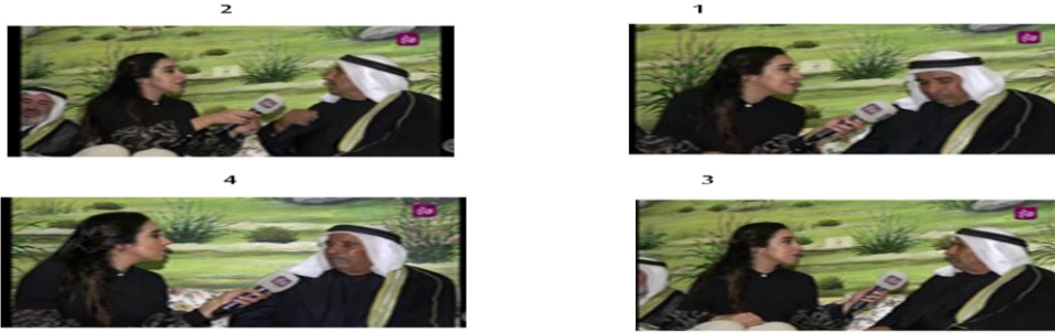
الشكل رقم 15: حالة من العجز

(عرب الرماضين www.youtube.com/watch?v=6c9YS3qnMcw الدقيقة: 6.29-8.10)