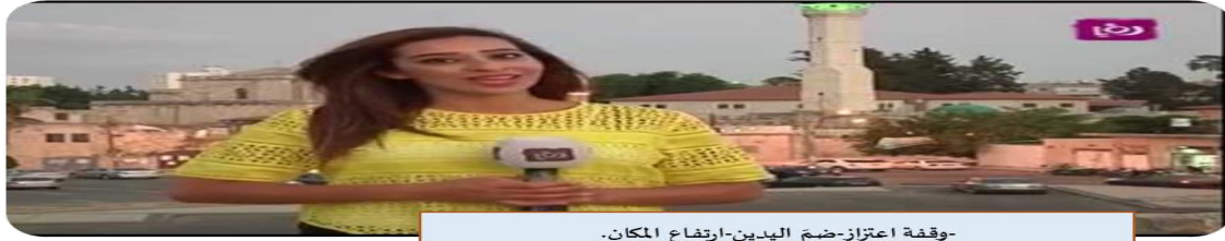
-وقفة اعتزاز-ضمم اليدين-ارتفاع المكان-

الحوار استمر لأكثر من أربع دقائق، مما يدل على اندماج المحاور مع المتحدث، من خلال السعادة البادية على وجهها، فالحديث كان عن التقاليد والعادات، وطبيعة أهل المنطقة. أما في جانب الحديث باعتزاز، والاندماج من العبارات، فيمكن بيانه في الشكل الآتي: الشكل رقم 12: اندماج مع لحظة الختام