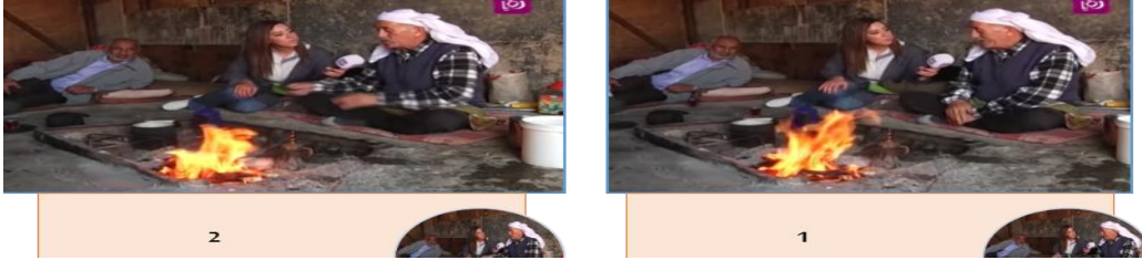
شكل رقم4: نموذج ثالث للتقارب الجسدي

https://www.youtube.com/watch?v=1ehL-DvwqE الدقيقة: 4.00-5.00