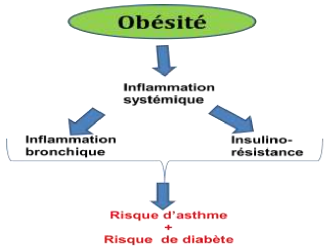
Figure 2. Effets de l'obésité sur l'asthme et le diabète.

A noter que l'obésité et l'hypereostrogénie sont deux facteurs de risque de l'insulinorésistance et par conséquent du diabète (23).