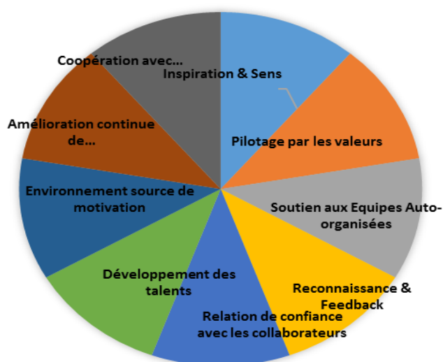
Figure n° 2 : La roue du management agile