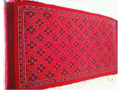
شكل رقم 2 زربية جبل العمور