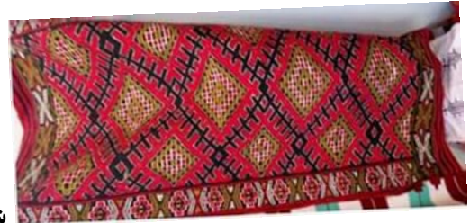
شكل رقم 3 زربية جبل العمور