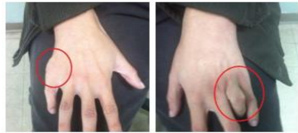
Figure 2. Poly-syndactylie opérée (Pr. N. Ghedjati)

L'électro-oculogramme (EOG) était altéré aux deux yeux, de même que l'électrorétinogramme (ERG) scotopique est altéré. L'ERG photopique, lui, était normal.