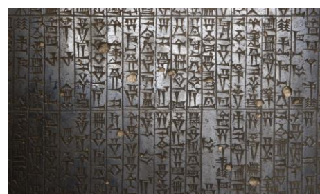
نص من شريعة حمورابي

وعليه من خلال توضيح محتوى شريعة حمورابي نلاحظ أنها المواد القانونية إلى ثلاثة زمر: المواد الاجتماعية، المواد الاقتصادية، الجرائم وعقوباتها .