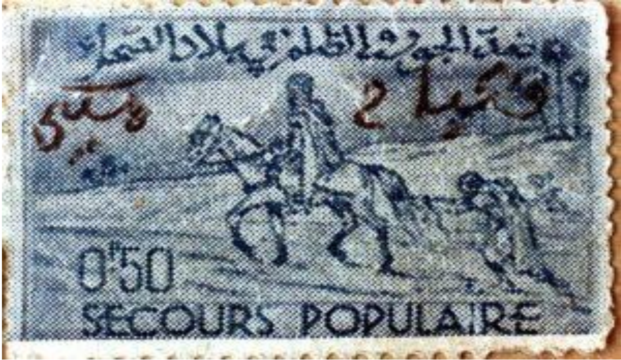
(22)- محمد عباس، "مذكرات شباح المكي، شيوعي بلغة القران"، جريدة الفجر، 16 ديسمبر 2012.

ملحق رقم 1: طابع البريد الذي وزع في إطار التضامن مع الشباح مكي بعد اعتقاله بطريقة مهينة من طرف القايد ابن قانة