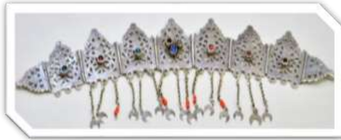
عصابة أم صف

أ-الناصية أم صف: تتكون من سبعة صفائح مثبتة بأزرار مشكلة افريز عريض ذو زخرفة زهرية مخرمة أو "مغربلة" كما يطلق عليها الصاغة النوايل، تتدلى منها سلاسل تحتوي على أهلة وخامسات والتي ترصع في مركزها بلألئ زجاجية، أما الواجهة العلوية للحلية فعادة ماتكون على شكل مثلثات مفصصة.