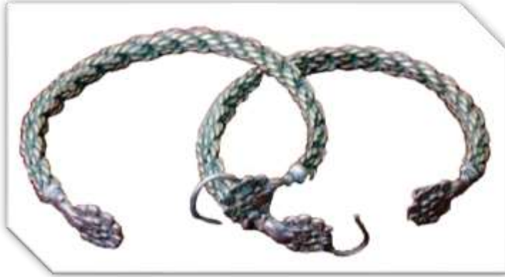
خلخال مظفورة (عن/ المتحف العمومي الوطني البارود)

د-خلخال مظفورة: عبارة عن حلقة دائرية تغلق بواسطة كلاب صغير موجود في الطرف الأول للخلخال الذي يثبت بنهاية طرفه الثاني، وهو على شكل رأس الحنش، وقد سمي بالمظفور لأنه عبارة عن ظفيرة مكونة من أربعة أزواج من الخيوط.