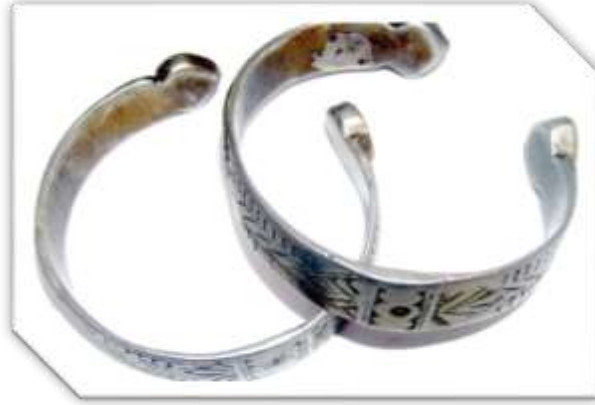
خلخال بطن الأفعى (عن/ متحف الفنون والتقاليد الشعبية)

د-خلخال مظفورة: عبارة عن حلقة دائرية تغلق بواسطة كلاب صغير موجود في الطرف الأول للخلخال الذي يثبت بنهاية طرفه الثاني، وهو على شكل رأس الحنش، وقد سمي بالمظفور لأنه عبارة عن ظفيرة مكونة من أربعة أزواج من الخيوط.