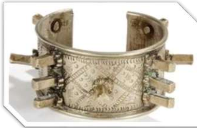
السوار (عن/ متحف الآثار والفنون الشعبية)

السوار: من أهم الحلي النابلية، فهو أكثر ما تتميز به المنطقة، فاستعماله شائع عند أولاد نابل الذي يبدو أنه موطنه الأم 1 ، حيث لا نجد صندوق حلي المرأة النابلية يخلو منه، فيشد الإنتباه بشكله العريض الشائك بواسطة رؤوس معدنية بارزة مربعة التقاسيم، يتراوح عددها ما بين ثلاثة (3) الى واحد وعشرون (21) ناب، هذه الأنبياب ترمز الى مكانة المرأة الاجتماعية، فكلما زاد العدد كانت مكانتها أسمى.