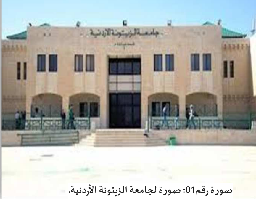
صورة رقم 01: صورة لجامعة الزيتونة الأردنية.