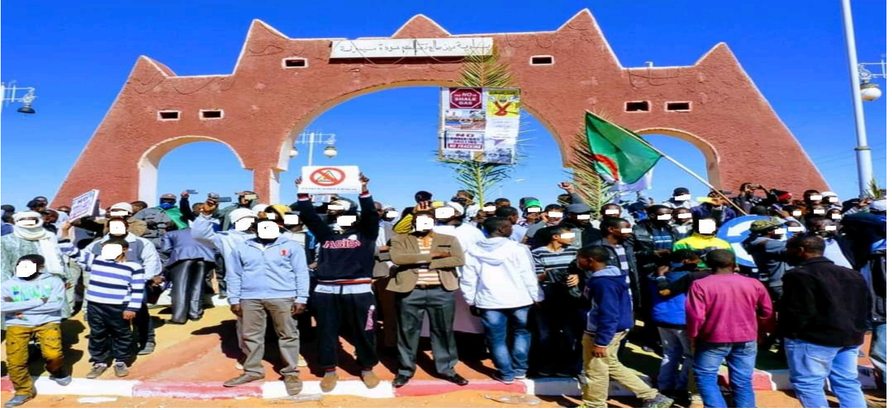
صورة(1) التقطت من الميدان معبرة عن وقفة احتجاجية للشباب أمام مدخل مدينة عين صالح

ثم انتقل السكان الى ساحة عمومية أمام مقر دائرة عين صالح وقرروا الاعتصام بالمكان حتى تنصت الحكومة ويتحقق الهدف من وراء هذا الاحتجاج السلمي، لكن وللأسف تدخلت القوة الأمنية (شرطة مكافحة الشغب) مرة أخرى لتفريق المعتصمين في ساحة سميت بعد ذلك بساحة الصمود، وقد كان لهذا الفعل عواقب وخيمة حيث إندلعت ثورة حقيقية قادها شباب المنطقة وقادوا هجوما عنيفا على مقر الشرطة بالمدينة وأحاطوا بالمكان من كل جهة وحدث اشتباك بين الطرفين استخدمت الشرطة فيها الغاز المسيل للدموع والرصاص المطاطي نتجت عنه خسائر مادية، (إحراق بعض سيارات الشرطة) وبعض الاصابات التي نقل اصحابها الى المستشفى على وجه السرعة، ولم يتوقف الأمر إلى أن بدأ بعض أعوان الشرطة باطلاق الرصاص الحي في السماء لإخافة المواطنين، ليتدخل السيد قائد القطاع العسكري بعين صالح ويقف بين الطرفين ويطالب بايقاف العراك، وطلب من المتظاهرين العودة لساحة الصمود ووعدهم بعدم تدخل القوة الامنية بعد اليوم (مقابلة ميدانية بعين صالح) .