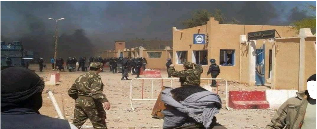
صورة(2) التقطت من الميدان توضح الصراع الذي حدث بين الشرطة والمحتجين بعين صالح

ثم انتقل السكان الى ساحة عمومية أمام مقر دائرة عين صالح وقرروا الاعتصام بالمكان حتى تنصت الحكومة ويتحقق الهدف من وراء هذا الاحتجاج السلمي، لكن وللأسف تدخلت القوة الأمنية (شرطة مكافحة الشغب) مرة أخرى لتفريق المعتصمين في ساحة سميت بعد ذلك بساحة الصمود، وقد كان لهذا الفعل عواقب وخيمة حيث إندلعت ثورة حقيقية قادها شباب المنطقة وقادوا هجوما عنيفا على مقر الشرطة بالمدينة وأحاطوا بالمكان من كل جهة وحدث اشتباك بين الطرفين استخدمت الشرطة فيها الغاز المسيل للدموع والرصاص المطاطي نتجت عنه خسائر مادية، (إحراق بعض سيارات الشرطة) وبعض الاصابات التي نقل اصحابها الى المستشفى على وجه السرعة، ولم يتوقف الأمر إلى أن بدأ بعض أعوان الشرطة باطلاق الرصاص الحي في السماء لإخافة المواطنين، ليتدخل السيد قائد القطاع العسكري بعين صالح ويقف بين الطرفين ويطالب بايقاف العراك، وطلب من المتظاهرين العودة لساحة الصمود ووعدهم بعدم تدخل القوة الامنية بعد اليوم (مقابلة ميدانية بعين صالح) .