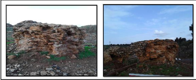
الشكل 4: قناة الري بالموقع الأثري ببلدية الروينة