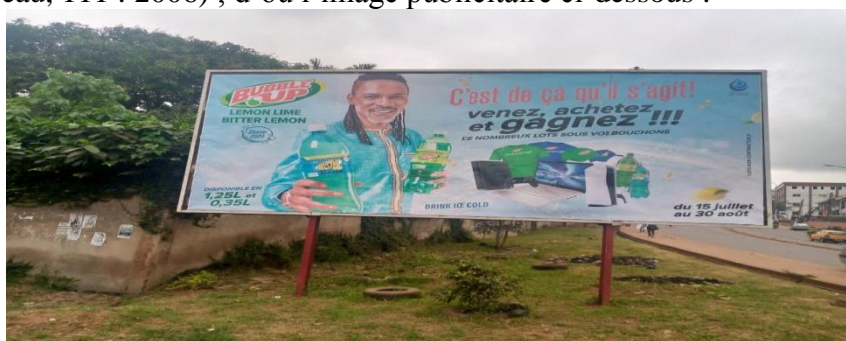
Figure 10 : photographie publicitaire d'une marque de boisson (juillet 2022).

Comme nous l'avons dit plus haut, les mots sont habités au gré de leurs usages et voyages discursifs. La mémoire d'un mot est traçable en vertu de sa circulation dans une certaine catégorie discursive dans laquelle elle assure le maintien de la lignée discursive. Dans le cas de l'expression « c'est de ça qu'il s'agit », il a été montré supra que sa circulation est féconde en fonction de son énonciation numérique. Une fois hors de la sphère numérique, elle constitue un cas de démemoire discursive, celle qui selon Paveau se produit par « rupture dans la chaîne mémorielle par changement de sens et/ou de situation discursive » (Paveau, 111 : 2006) ; d'où l'image publicitaire ci-dessous :