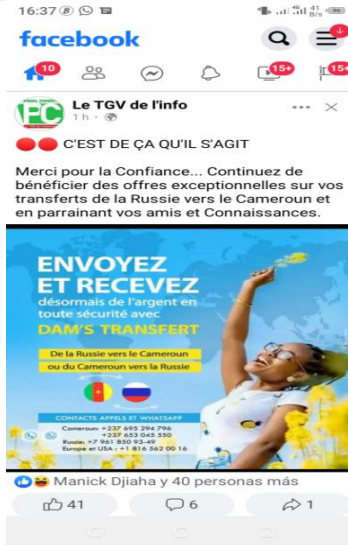
Figures 1, 2 et 3 : captures d'écran statiques sous Androïde

Dans les trois figures, l'expression est placée en sentinelle en guise d'introduction d'un univers infra discursif dont elle accrédite d'emblée le contenu.