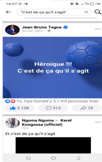
Figures 7, 8 et 9 : captures d'écran statiques sous Androïde

Comme on peut le remarquer, dans les cas le positionnement discursif de l'expression lui donne le statut de d'estampille technolinguistique. Nous nous référons au fait qu'en apparaissant à la fin d'un dont il est décalé, il en devient sa signature ; une signature qui vient mettre en emphase ce qui est dit supra : une évidence tout simplement. Dans les trois cas l'expression fonctionne comme un marqueur épistémique qui met en exergue l'évidence des savoirs partagés par les