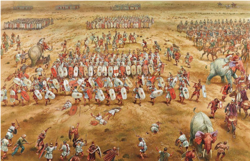
Fig 2: La battaglia di Zama

“... Zama est sans doute la ville que des textes appellent Zama Regia. Or la même épithète est jointe à d'autres noms de lieux. Parfois, ce sont peut-être seulement de grands domaines, appartenant aux souverains .... » (Gsell, 1927, p.235)