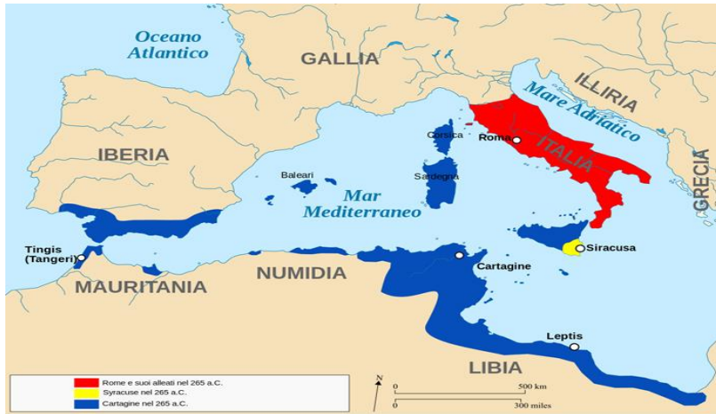
Fig1: mappa di guerre puniche