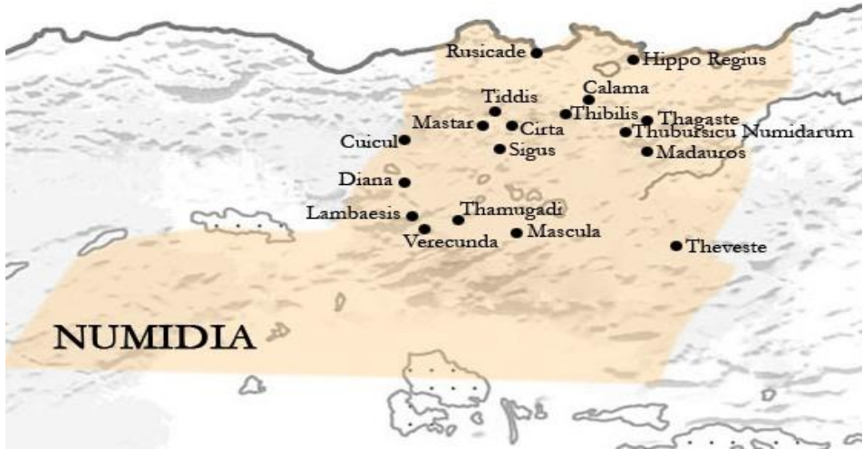
Fig 3: Numidia in età romana

Dal 206 a.C. Roma vinse la guerra in Spagna, e si avvicinava in Africa, Siface cambiava posizione e si alleò con Cartagine questo si manifesta con il matrimonio con la figlia del generale Astrubale Giscone, dopo la famosa battaglia di Zama, Massinissa ne divenne re, mantenendo però l'alleanza con Roma ed iniziando ed inglobare territori e città di Cartagine.