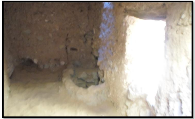
الصورة رقم 02 البئر التي تستعمل في حالة الحصار