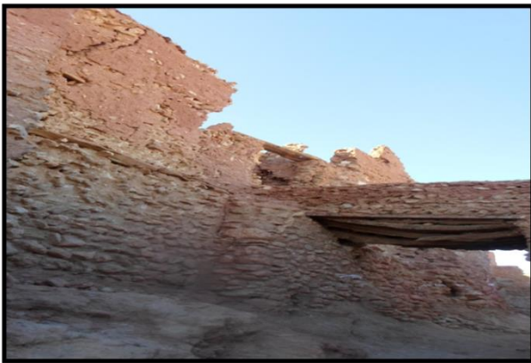
الصورة رقم 06 القنطرة