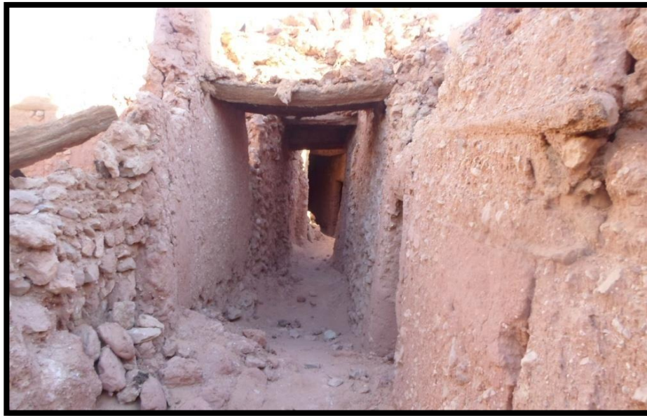
الصورة 01 نموذج ل احد شوارع قصر تماسخت