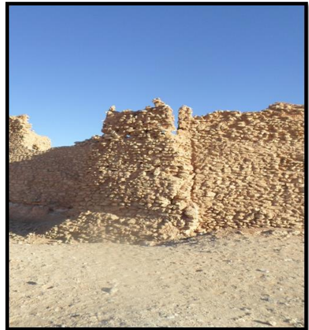
الصورة رقم 04 أحد أبراج قصر تماسخت