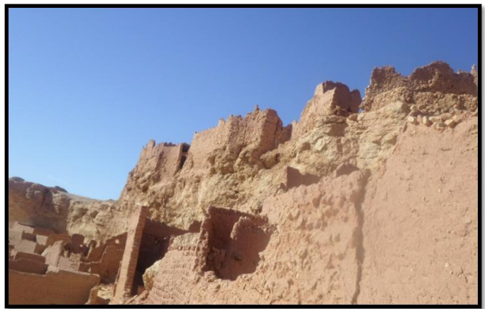
الصورة رقم 03 أحد الجهات لسور قصر تماسخت