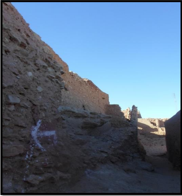
الصورة رقم 05 الخندق في قصر تماسخت