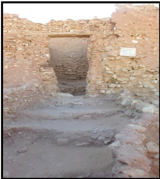
الصورة رقم 07 مدخل القصر