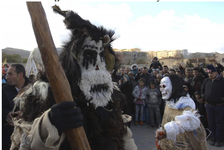
Figure N° 5. Le carnaval d'ayred.