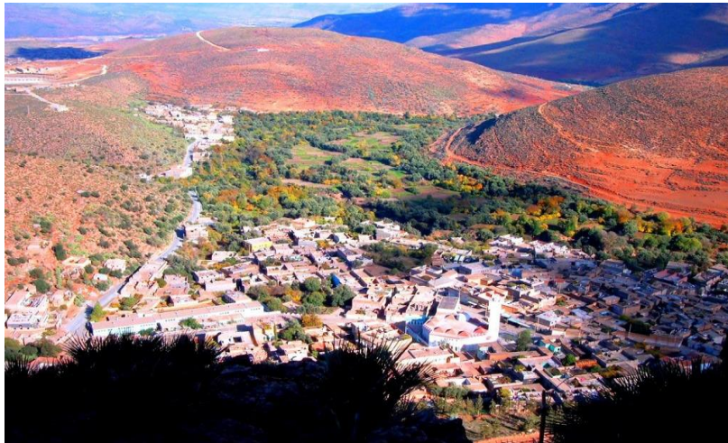
Figure N° 2. Vu panoramique de la Daïra de Beni snous.