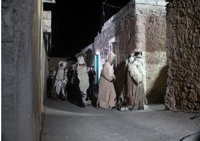
Figure N° 4 : Carnaval Ayred célébré dans la région de Beni Snous.