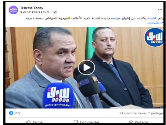
المصدر: صفحّة فايسبوك -Tebessa today-

وتشير هذه النتائج إلى أن الصّفحة الإخبارية موضع الدراسة، يغلب عليها طابع الأخبار العامّة والرّسميّة، مع محاولة إسناد المعلومة أو الخبر إلى المصدر الموثوق تفادياً للوقوع في المحظور والمتابعات القانونيّة، والملاحظ أيضاً محاولة القائمين على الصّفحة انتهاز العمل الصحفي باحترافيّة من خلال متابعة الأخبار الرّسميّة التي تهم الشّأن العام المحلي، إضافة إلى الاهتمام بانشغالات المواطن المحلي ونشر كل ما يتعلّق باهتماماته.