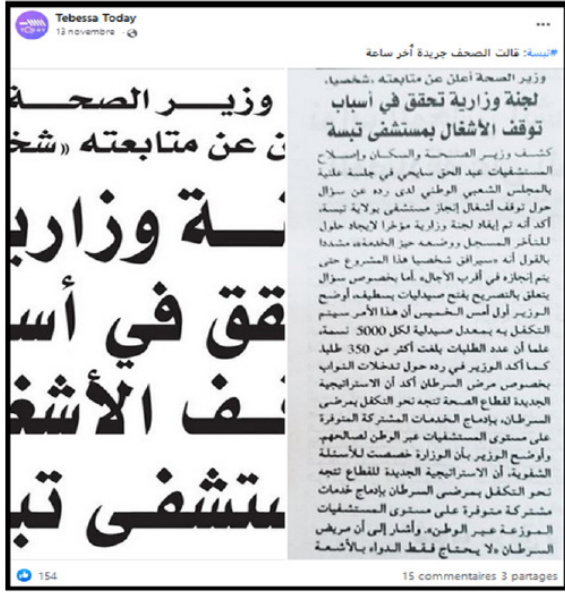
المصدر: صفحة فيسبوك - Tebessa today -