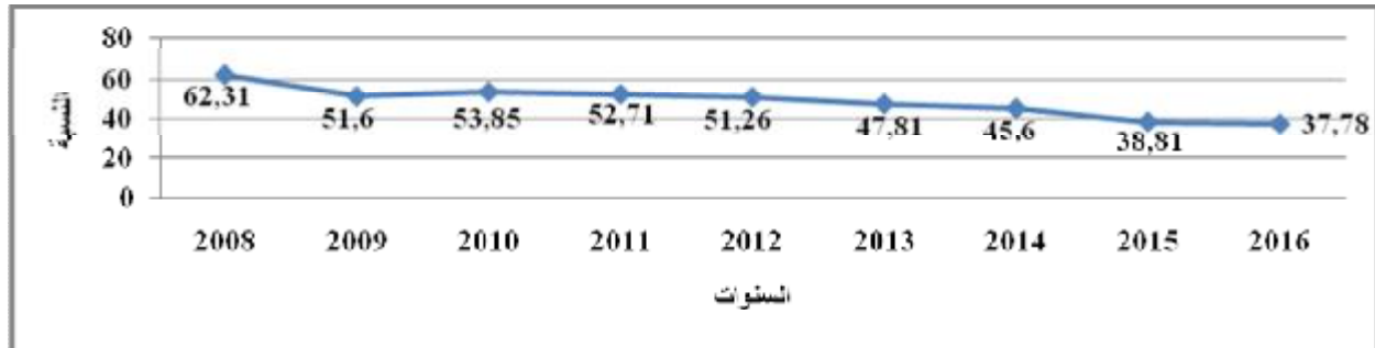
الشكل رقم 03: نسبة الانتاج الصناعي في الناتج المحلي الاجمالي