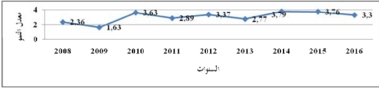
الشكل رقم 02: معدل نمو الناتج المحلي الاجمالي