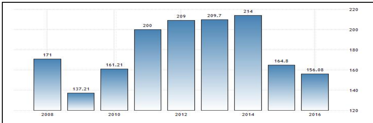
الشكل رقم 01: إجمالي الناتج المحلي الخام (مليار دولار)