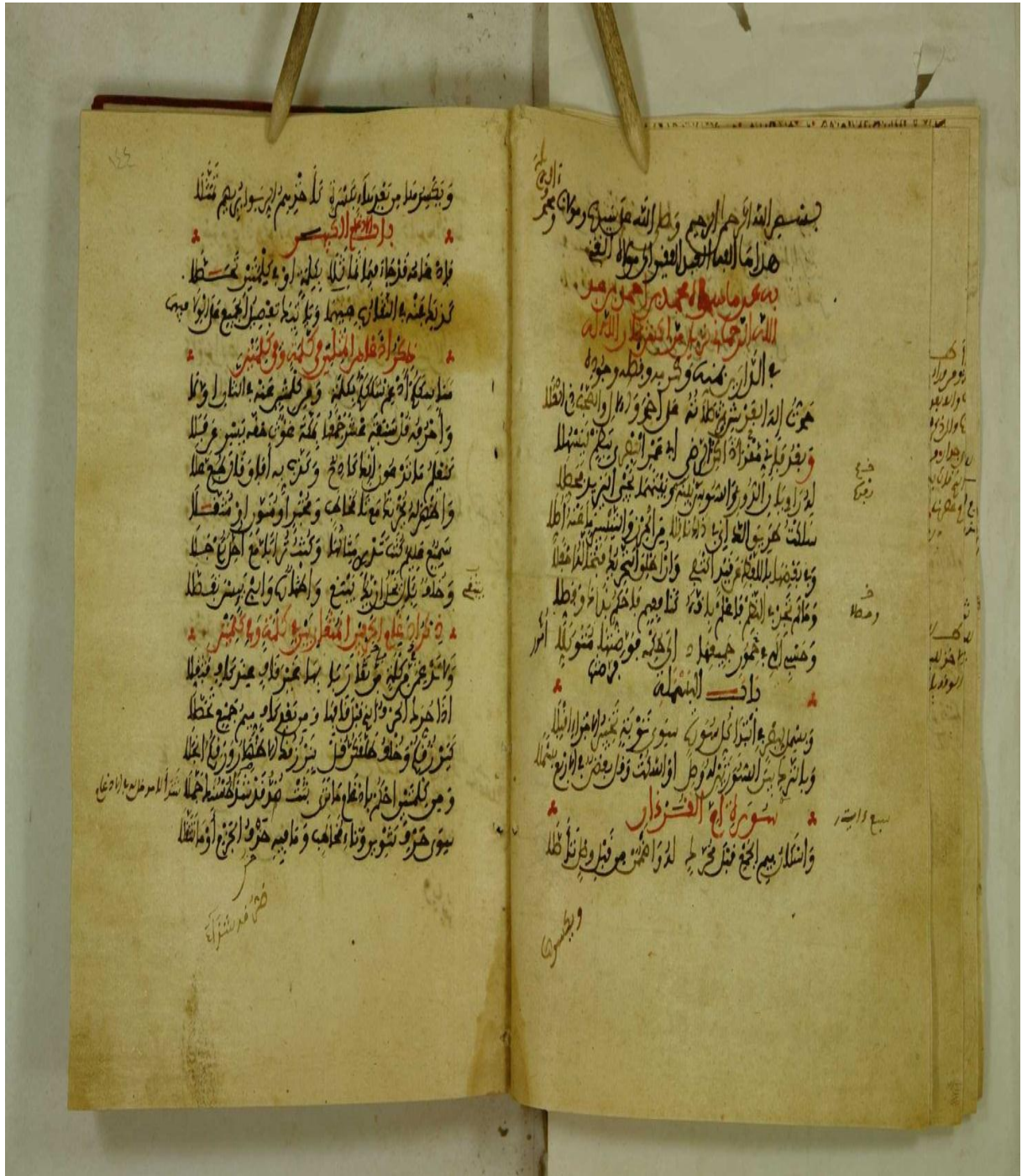
صورة من نسخة رقم (2)