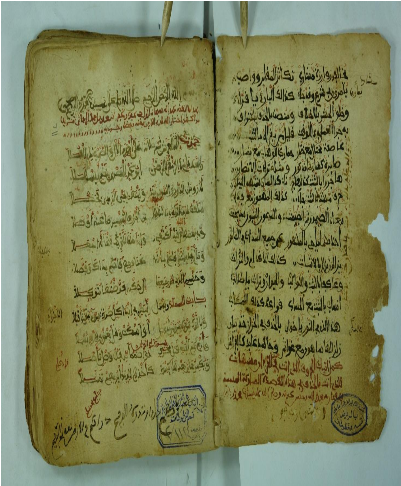
صورة من نسخة رقم (3)