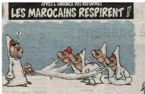
Figure.7. Après l'annonce des réformes. Les Marocains Respirent !

• Le Roi Mohammed 6 a entrepris, le 17 juin 2011, des réformes constitutionnelles remplaçant la Constitution de 1996 héritée de son père. Les marocains ont alors exprimé leur joie dans les rues de Rabat. Selon cette caricature nous pouvons dire que les réformes annoncées par le Roi ne sont qu'un écran de fumée. Cette fumée est hallucinogène comme celles des joints. Ce n'est donc que de la poudre aux yeux.