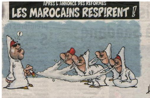
Fig.16. Après l'annonce des réformes. Les Marocains Respirent !

Dessin(-) / texte(+) : ici le texte l'emporte sur l'image en fournissant un grand nombre d'informations, ce qui n'est pas le cas pour le dessin du moment où il est écrasé sous l'ampleur du texte. Nous pourrions donc parler d'un autre type c'est celui du texte illustré.