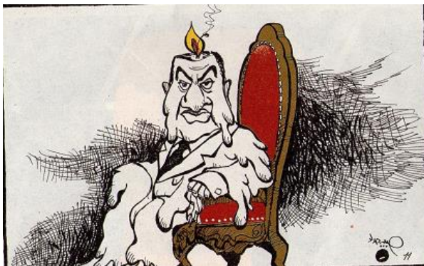
Figure.11. Sans nom©, Courrier international, n°1081.

- Plan moyen : c'est un plan qui s'oppose au précédent et dans lequel le regard est centré sur le personnage. À la manière de l'exemple suivant :