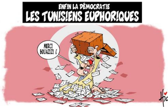
Figure.6. Enfin la Démocratie. Les tunisiens euphoriques

• Les tunisiens sont redevables à Mohammed Bouazizi, le jeune marchand ambulancier qui s'est immolé par le feu à Sidi Bouzid, ce qui a fait de lui un catalyseur