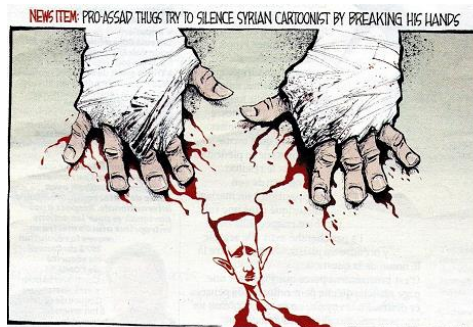
Figure.8. News Item : pro-Assad thugs try to silence syrien cartoonist by breaking his hands©, Courrier international, n°1087.

Notons aussi que les traits de visage se déforment beaucoup plus sous l'effet de ces deux derniers angles. L'exemple ci-dessous puise de cette technique :