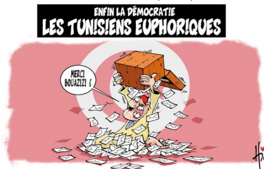
Figure.15. la Démocratie. Les tunisiens euphoriques

Dessin(+)/ texte(-) : c'est lorsque l'image est riche se suffisant à elle-même mais se trouvant accompagnée d'un texte qui n'ajoute rien au sens et crée une sorte de redondance verbale. Dans l'exemple qui suit, le récitatif est facultatif, car nous pourrions, rien qu'à partir du dessin, comprendre qu'il s'agit de la joie qui emporte les tunisiens après la révolution :