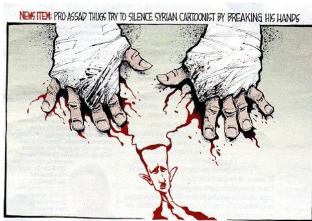
Figure.3. News Item : pro-Assad thugs try to silence syrien cartoonist by breaking his hands©, Courrier international, n°1087.

•"Les pro-Assad essaient de maintenir en silence le dessinateur syrien Ali Farzat en cassant ses mains". Or, Ali Farzat, après avoir été rossé de coups et avec un acharnement sur ses mains, s'obstine toujours à dessiner et à contester le régime en place même avec son sang, un sang qui nourrit la terre syrienne et qui exhibe son bourreau en la personne d'El Assad. Une preuve de courage et de combat pour la liberté de l'esprit.