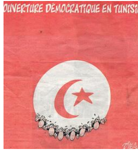
Figure.5. Sans nom©, Courrier international, n°1081.