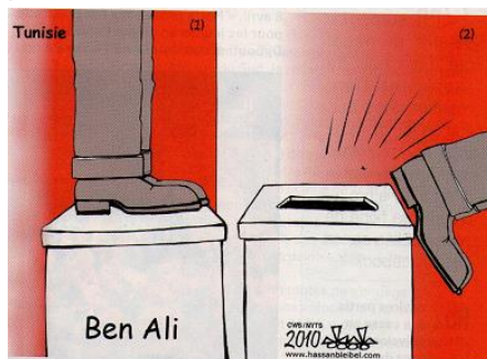
Figure.9. Sans nom©, Jeune Afrique, n°2611.

• Cette caricature semble divisée en deux : le premier piédestal sur lequel repose la statue de Ben Ali représente la Tunisie avant la révolution, le deuxième est sous forme de urne pour illustrer le départ précipité de Ben Ali ,le 14 janvier 2011, laissant place aux élections, piliers et fondement de la liberté d'expression.