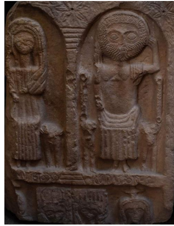
ملحق 6: نصب لساتورن بالمتحف الوطني لتبسة عن غواس زهراء