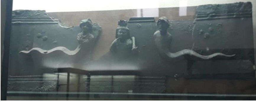
ملحق 10: جزء من مذبح الآلهة المصرية للامباز في متحف الآثار القديمة عن غواس زهراء