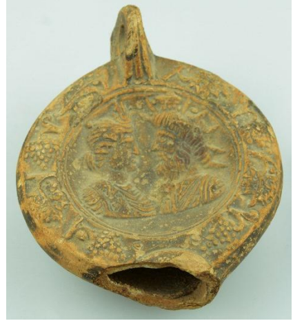
ملحق 2: مصباح يحمل صورة سيرابيس في متحف سيرتا عن المتحف الوطني سيرتا