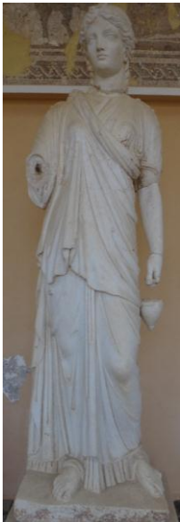
ملحق 9: تمثال الإلهة إيزيس بمتحف شرشال عن غواس زهراء