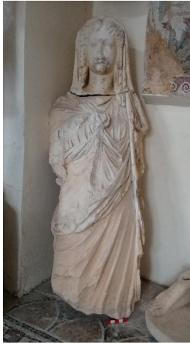
ملحق 7: تمثال الإلهة إيزيس بمتحف تازولت عن غواس زهراء