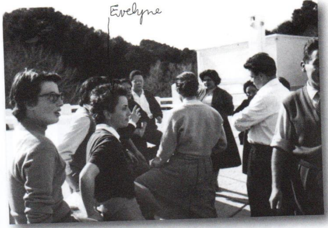
تجمع جمعية الشباب (العاصمة 1950) الصورة التي عثرت عليها الشرطة و بها تم إلقاء القبض عليها