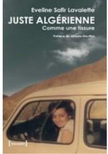
صورة غلاف الكتاب

ملحق الصور: صور مأخوذة من الكتاب (جزائرية فقط... مثل نسيج )