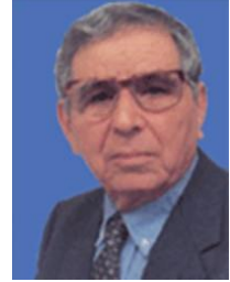
المجاهد الراحل الحاج بن علا