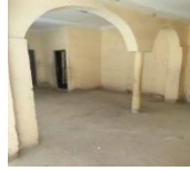
الصورة رقم 24 توضح سواري أخذت هذه الصورة من قصر بوفادي

1.4.3. التعريف الاصطلاحي للسواري: سواري القصر أو البيت: أعمدته. فأوجعها ضرباً وأوثقها الى سارية من سواري البيت (معنى كلمة سواري، 2022). يطلق محلياً كلمة السواري على الرجة التي يوجد بها الأقواس.