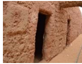
الصورة رقم: 01 توضح مدخل المنزل،

1.1. فَم الدَّار: فَم الدَّار، هو مدخل المنزل باللهجة التواتية، وهو أول عنصر نصادفه عند دخولنا للمنزل، يُطلق عليه باللهجة الزناتية: أتاف أن تداحت أو امي تئيداحت (جودي، 2022). وأُستخدمت كلمة "فَم" بمثابة تشبيه بليغ، كونه مدخل تعبر من خلالها الأشياء.