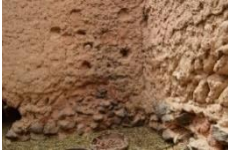
الصورة رقم 13

عندما تُطل على أسفل الكانيف نجد غرفة تصريف الفضلات التي يُطلق عليها محلياً اسم "ساس الكانيف" ويتم تفريغ هذه الغرفة بشكل دوري بإحداث ثُقُب في جدرانها المؤدي إلى الشارع الخلفي ويتم الاستعانة عادة بالحمير، حيث تُجمع كل تلك الفضلات وتتم معالجتها ووضعها في البستان كسماد.