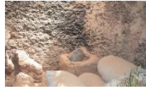
الصورة رقم: 23 توضح تويقَمي أخذت الصورة من منزل تقليدي في

تويقَمي : مكان توضع فيه مختلف الموائد التقليدية لطهو الخبز، مثل موقد أنور المحلي أو لدفن الكسرة المحلية بالطريقة التي تُسمى البوغة.