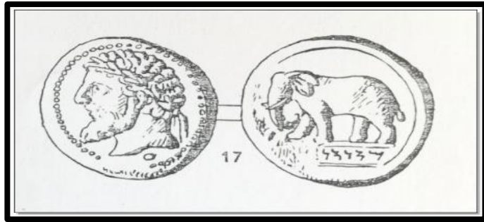
الشكل (01) قطعة نقدية

والجدير بالذكر أن المسكوكات التي ضربت في عهد "ماسينيسا" أظهرت لنا ملامح شخص ملتحي ذو ملامح وجه رقيق وعينان واسعتان و حاجبان رفيعان وشعر كثيف مجعد، كما ذكرت لنا المصادر أيضا ، انه كان ذو بنية قوية طويلة القامة شجاع وقوي، وكان بإمكانه أن يظل على صهوة فرسه طيلة اليوم دون أن يكل أو يمل، هذا ما منحه القوة في المشاركة في المعارك ضد قرطاجة و سنة 88 عاما دون أن يناله الضرر 9 . هذا عن شخصيته فكيف أستطاع اعتلاء عرش الماسيلي؟