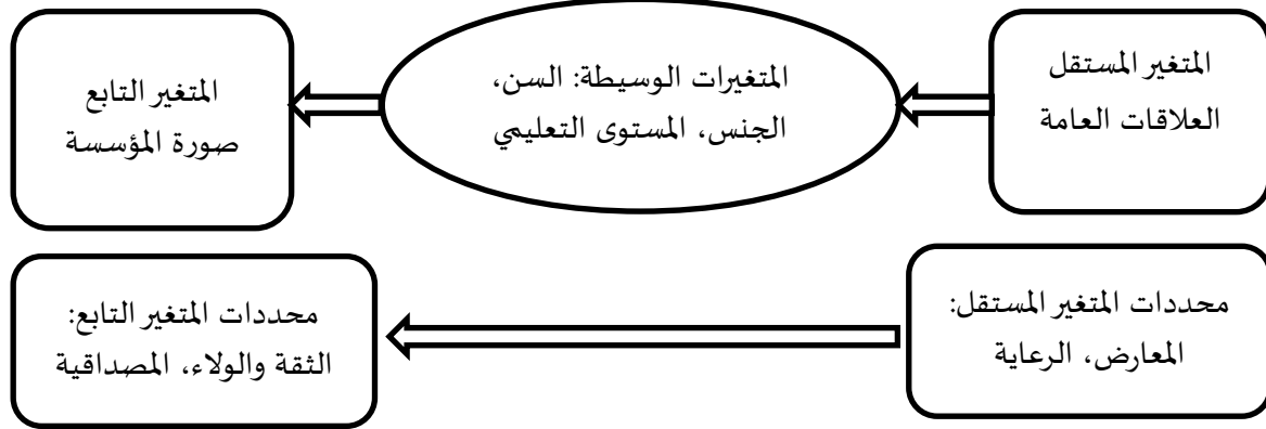
الشكل 01 : متغيرات الدراسة