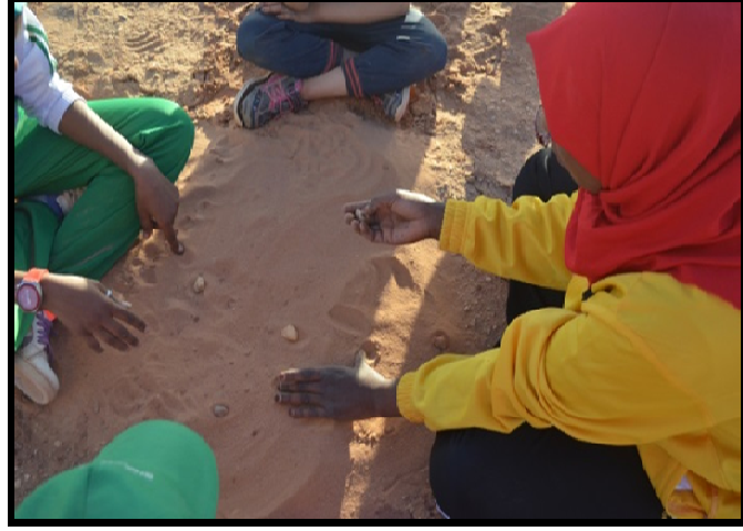
لعبة لما غيط :

هي لعبة من الالعب الترفيهية الرياضية وهي لعبة يمارسها الفتيات وهي عبارة عن تخطيط ميدان على الرمل وتحتوي على شكلين شكل طائرة وشكل شكولاتة