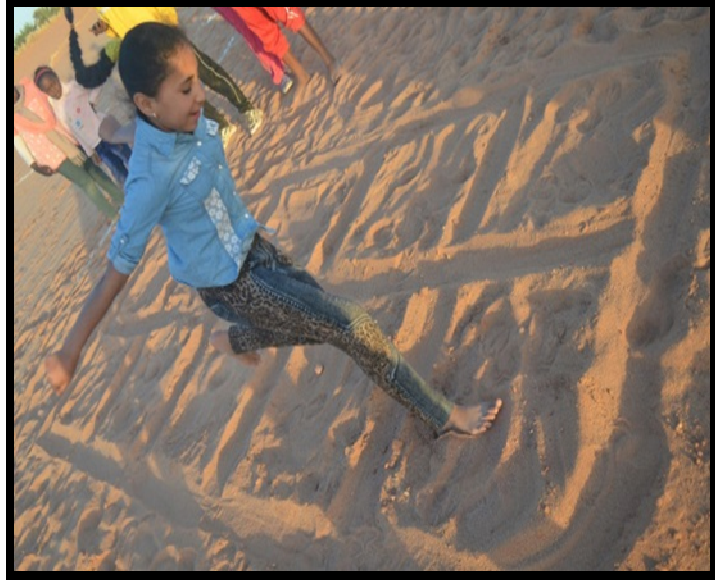
لعبة بوكرورو :

هي لعبة من الالعب الترفيهية الرياضية وهي لعبة يمارسها الفتيات وهي عبارة عن تخطيط ميدان على الرمل وتحتوي على شكلين شكل طائرة وشكل شكولاتة