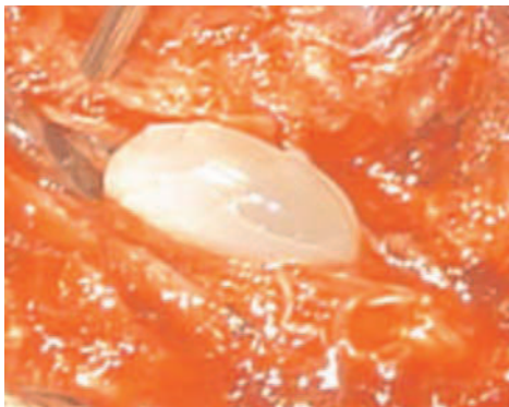
Fig. 3 : photo de l'extirpation du kyste dès l'ouverture de la dure-mère

Le patient a été opéré en urgence. L'intervention a permis, à travers une laminectomie de D12-L2 et ouverture longitudinale de la dure-mère, l'extirpation d'une grosse vésicule hydatique (Fig 3). La fermeture est précédée d'un rinçage au sérum salé hypertonique. Le patient est par la suite immobilisé par un corset plâtré. L'histologie confirme l'hydatidose en retrouvant des membranes hydatique. Un traitement à base d'Albendazole a été institué en post opératoire immédiat. 6 mois plus tard le patient a récupéré de tous ses troubles neurologiques.