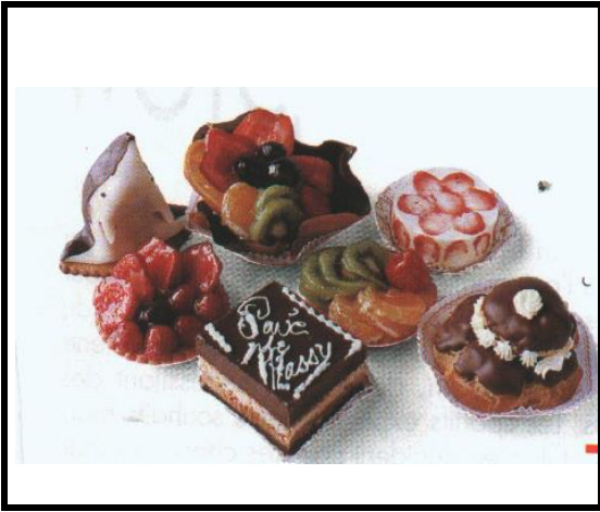
g m 2