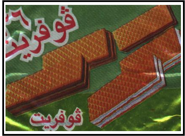
g m 1