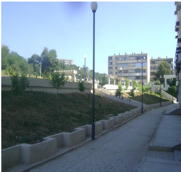
Photo n° 11 : le reboisement de l'espace extérieur

Afin d'atteindre cet objectif, la cité du 20 août a connu un reboisement considérable (photo n° 11) de tous les espaces extérieurs qui ont été complétés par des équipements d'agréments pour les usagers le mobilier urbain (bancs de repos, éclairages, etc).