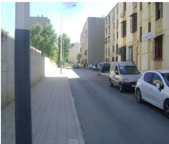
Photos n°8 : reprise de la chaussée et des trottoirs