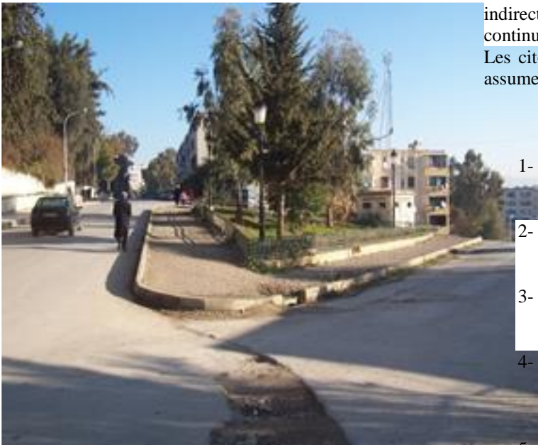
Photo n°12 : dégradation de la chaussée après une année de sa réalisation

Même si l'incivisme de certains citoyens y est pour quelque chose, les autorités ont eux aussi une part de responsabilité [5]. En effet, lorsque la direction de l'urbanisme effectue des aménagements, le suivi et les petits nettoyages doivent être assurés par l'APC, mais malheureusement ce n'est toujours pas le cas. Ce laisser-aller se fait malheureusement sentir au fil des mois, et dans certaines cités on est donc obligé de recommencer les travaux.