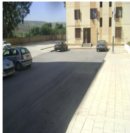
Photo n°10 : reprise de la chaussée, du trottoir et de l'assainissement