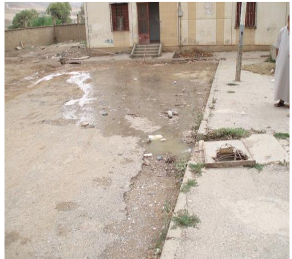
Photo n°9 : dégradation de la chaussée, des trottoirs et écoulement des eaux usées en plein air.