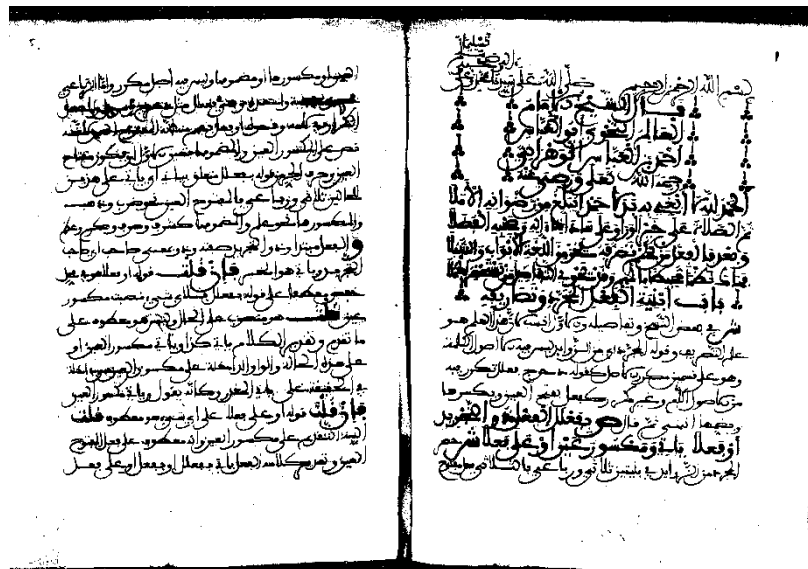
نسخة ثانية في مكتبة الإسكوريال- إسبانيا