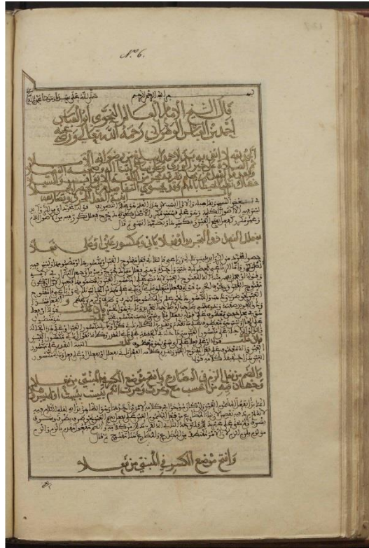
نسخة أولى في مكتبة الإسكوريال- إسبانيا