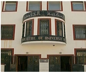
صورة رقم (01):

جميع التخصصات الموجودة على مستوى جامعة الجزائر 2 مثل علم النفس و علم المكتبات و التاريخ و اللغات. وتعتمد المكتبة على الرفوف المفتوحة في عرض مجموعاتها في قاعة الدوريات و المراجع.