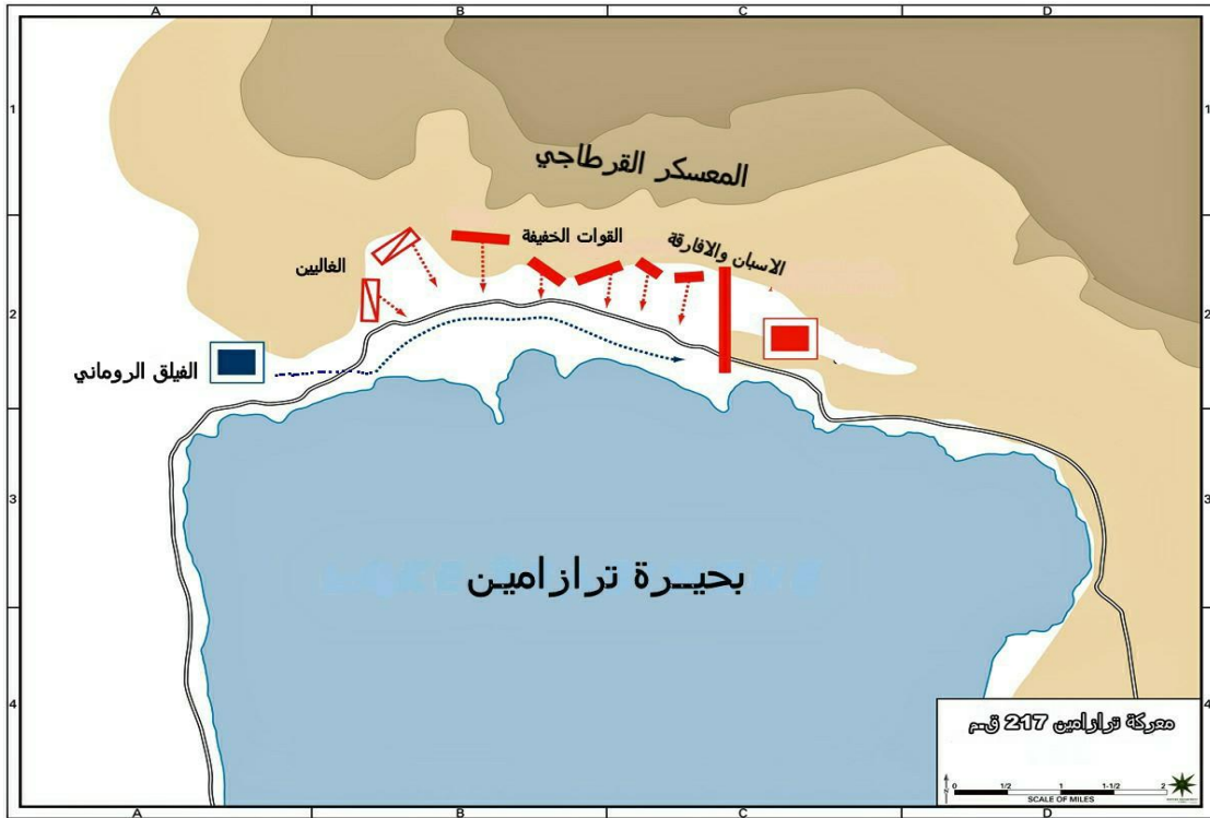
الشكل -2- خريطة سير معركة ترازمانيا