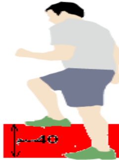
شكل: إختبار الخطوة لدقيقة step test "1"