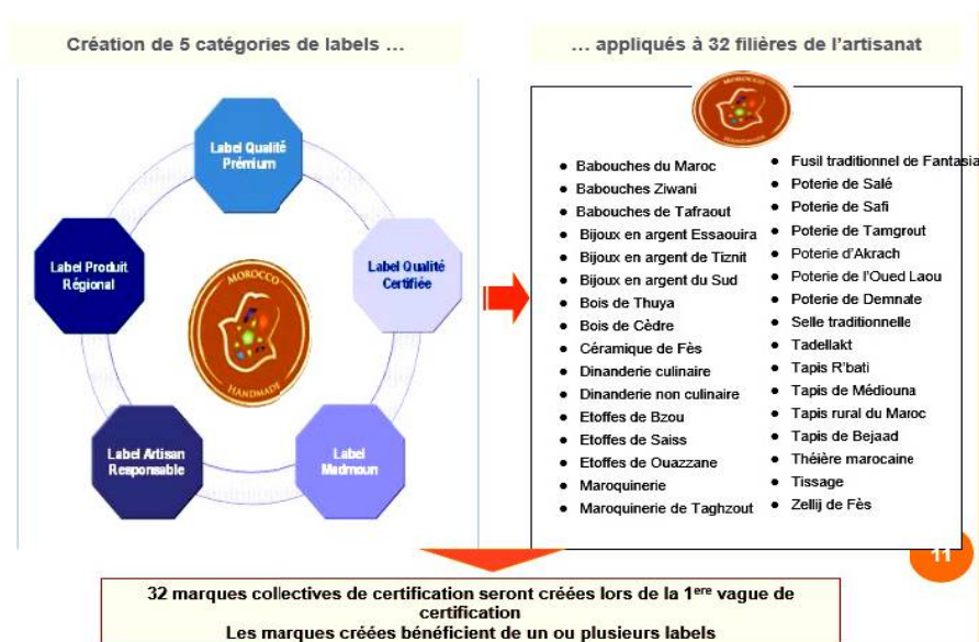
Figure n°1: Programme de labellisation établie par la stratégie de labellisation