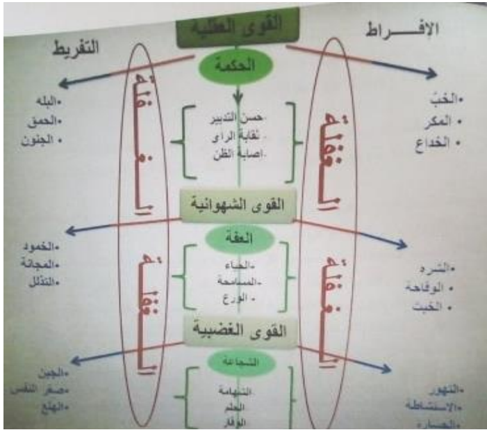
شكل رقم (03): يبين مسالك الطاقات في العقل الباطن

الثاني (المهلع) فهو مرض عصابي يندرج ضمن أحد اضطرابات القلق، وهذا ما يوضحه الشكل التالي: