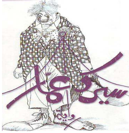
الصورة رقم 5: ( شخصية مثبتة على غلاف الرواية).

تحتل هذه الشخصية مساحة كبيرة من غلاف الرواية، مما يجعلها أكثر بروزا وإثارة. وهذا في نظرنا يعد مؤشرا أوليا على حضور الشخصيات بشكل قوي في هذه الرواية. لكن التأمل في الشكل الفيزيولوجي لهذه الشخصية الذي تمدنا به الواجهة الأمامية، يجعلنا ونحن نحاول بناء مجموعة من الفرضيات للقراءة، نشك في تصنيفها ضمن فصيلة الإنسان. فهي تبدو شخصية بهلوانية أو على الأقل تتقمص شخصية البهلوان، حيث نلاحظ سروالا قصيرا في مقابل معطف عريض ونعل كبير، بل إن الرجل اليسرى ترتدي نعلا في مقابل الرجل اليمنى الحافية. ثم نلاحظ عينا مفتوحة كبيرة ذات حاجب مرفوع نحو الأعلى في مقابل عين صغيرة مغلقة، ذات حاجب منحني نحو الأسفل، علاوة على الأنف الكبير والشعر غير الطبيعي...إلخ. وهذا يشكل نوعا من المفارقة الناتجة عن هذه الثنائيات المتناقضة التي تبعث على الضحك الذي يكشف التحليل على مستوى بنية العوامل أنه قيمة من ضمن قيم نواة أخرى تهض عليها الرواية.