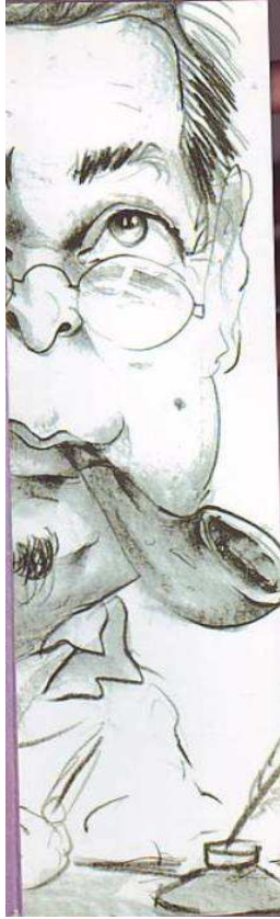
الصورة رقم 6: (صورة تحيل على سعيد علوش الشخص)

وفي إطار مقاربتنا للدليل الأيقوني دائماً، نلاحظ أن المؤلف دأب في رواياته الثلاث الأخيرة (سيرك عمار(2008)، مدن السكر(2009)، كاميكاز (2010)) على وضع صورته على نصف الغلاف الداخلي الخلفي للرواية كما يتضح من خلال الصورة رقم 6.