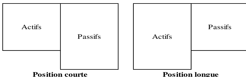
Figure 2 : Les positions de change Devise XXX

Source :Sylvie de Coussergues et Gautier Bourdeaux. Op-cit. p 221.