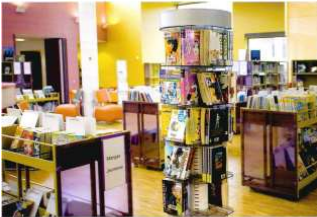
Photo n°7 : Présentoirs de livres