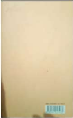
- الواجهة الخلفية: