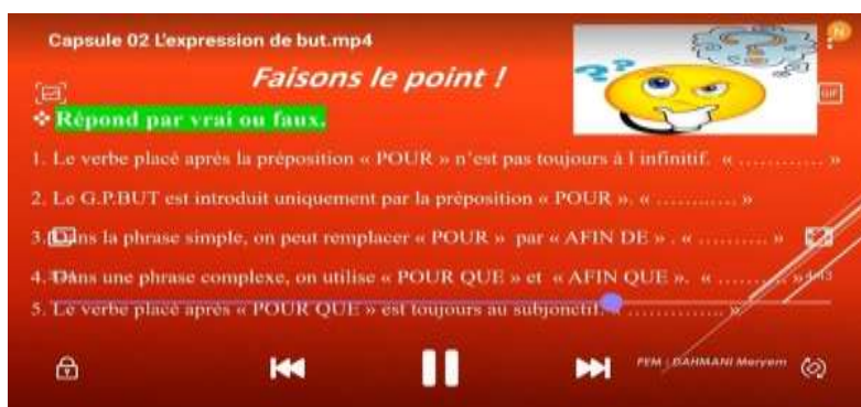
Figure 02 : Capture d'écran d'une activité intégrée dans la capsule vidéo.

Par la suite, nous avons demandé aux élèves qui disposent du matériel numérique sans avoir accès à internet de ramener des clés USB pour pouvoir leur transférer la capsule vidéo à visionner à laquelle nous avons ajouté les exercices sous formes écrites dans les diapositifs comme c'est mentionné ci-dessous :