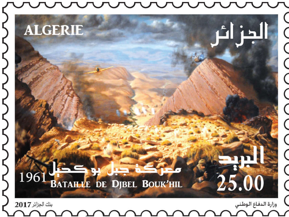
شكل (9) طابع بريدي لمعركة جبل بوكحيل