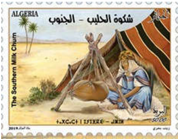
شكل (17) : طابع بريدي جزائري-البرنوس-الجنوب

https://chaouki-li-qacentina.blog4ever.com/emission-082009-bijoux-du-sud-algerien