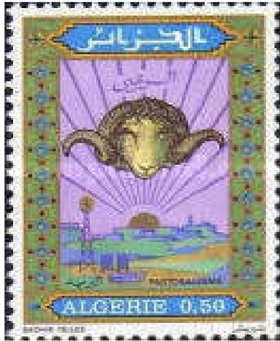
شكل (10) طابع بريدي - الرعي

https://www.stampworld.com/fr/stamps/Algeria/Postage%20stamps/1970-1979?year=1976