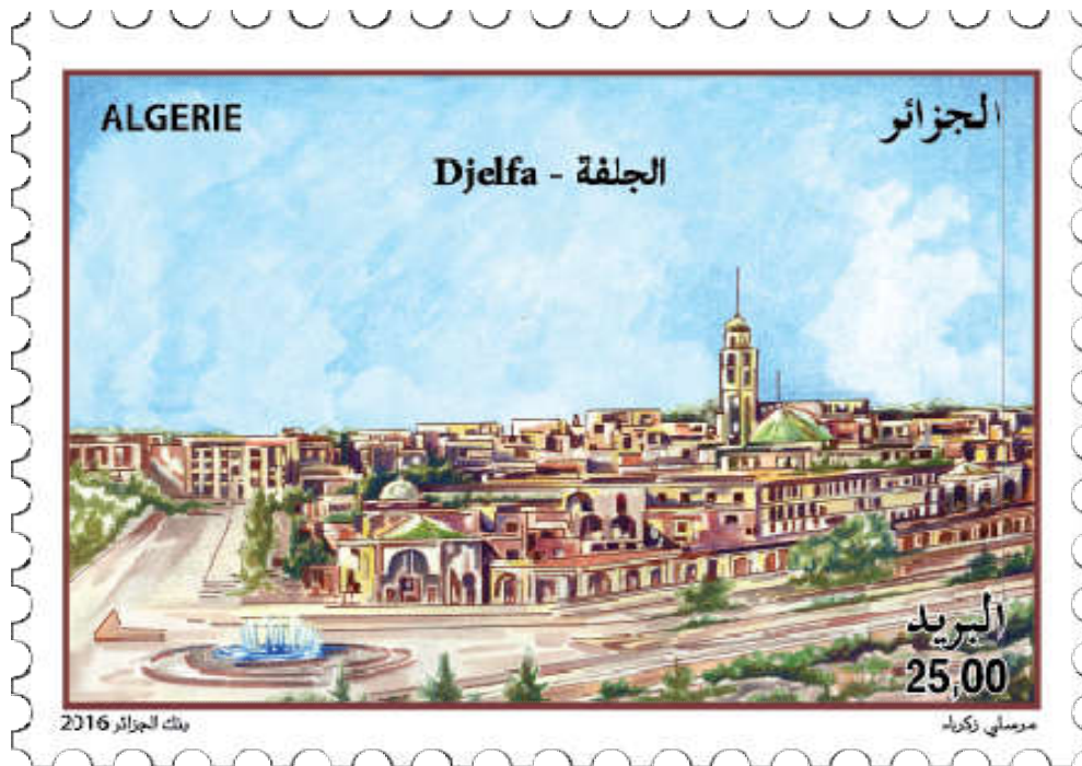
شكل (8) طابع بريدي لمدينة الجلفة

https://chaouki-li-qacentina.blog4ever.com/emission-031987-gravures-rupestres-de-laatlas