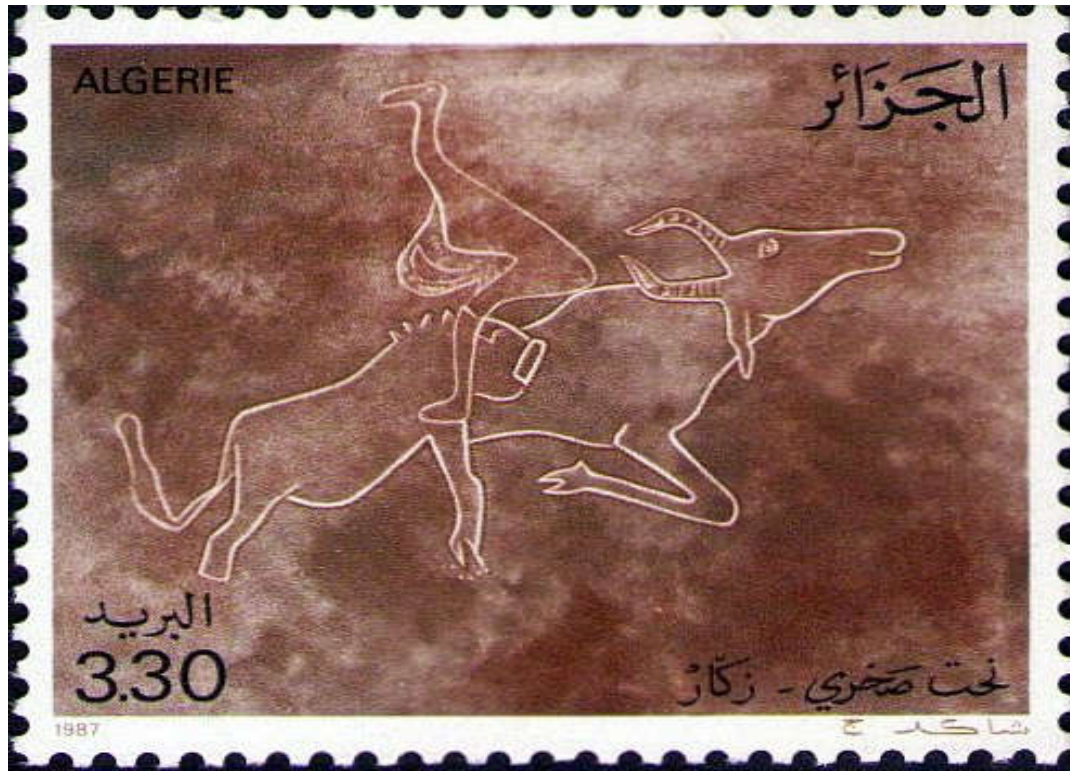
شكل (7) طابع بريدي لنحت صخري - زكّار

https://chaouki-li-qacentina.blog4ever.com/emission-031987-gravures-rupestres-de-laatlas