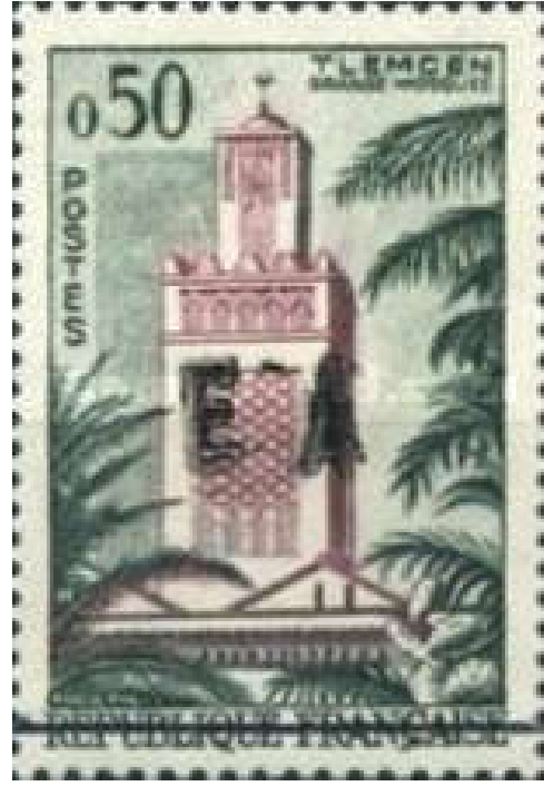
شكل (4) احد أوائل طوابع البريد الجزائرية بعد الاستقلال لشكل (5) اول طابع بريدي جزائري بالعربية 1 نوفمبر 1962