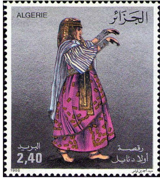
شكل (12) طابع بريدي جزائري-رقصة أولاد نايلشكل (13) طابع بريدي جزائري-تثبيت الكثبان

https://chaouki-li-qacentina.blog4ever.com/emission-131986-danses-folkloriques