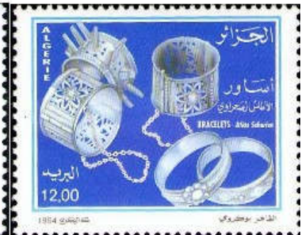
شكل (14) إصدار مجموعة طوابع حلي الأطلس الصحراوي 1994

https://chaouki-li-qacentina.blog4ever.com/emission-091994-bijoux-de-laatlas-saharien