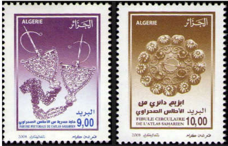
شكل (15) إصدار مجموعة طوابع حلي الجنوب الجزائري

https://chaouki-li-qacentina.blog4ever.com/emission-082009-bijoux-du-sud-algerien