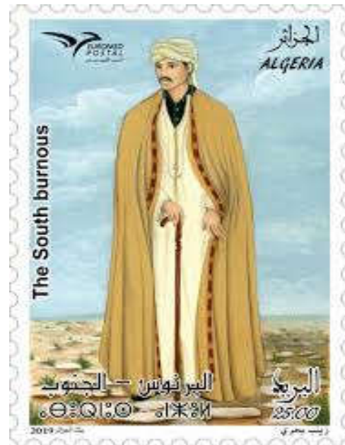
شكل (16) : طابع بريدي جزائري-البرنوس-الجنوب

https://www.poste.dz/philately/s/1429 https://www.poste.dz/philately/s/1415