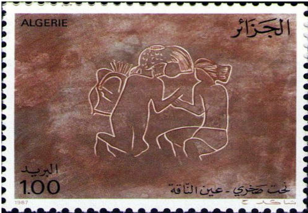
شكل (6) طابع بريدي لثحت صخري - عين الناقة

https://www.stampworld.com/fr/stamps/Algeria/Postage%20stamps/1960-1969